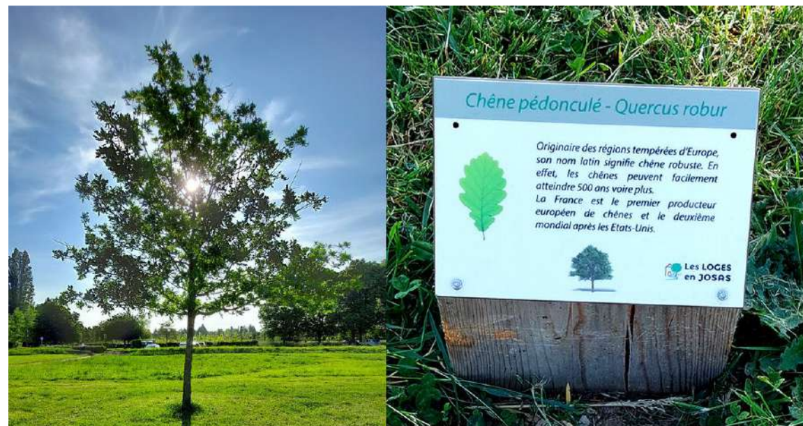
Arbres à l'honneur